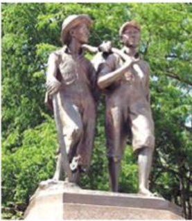
Ф. Хаббард. Пам'ятник Тому Сойєру та Геку Фінну в Ганнібалі

Здоров'я Марка Твена остаточно похитнулася, коли в 1909 році він втратив свого близького друга, нафтового магната Генрі Роджерса.